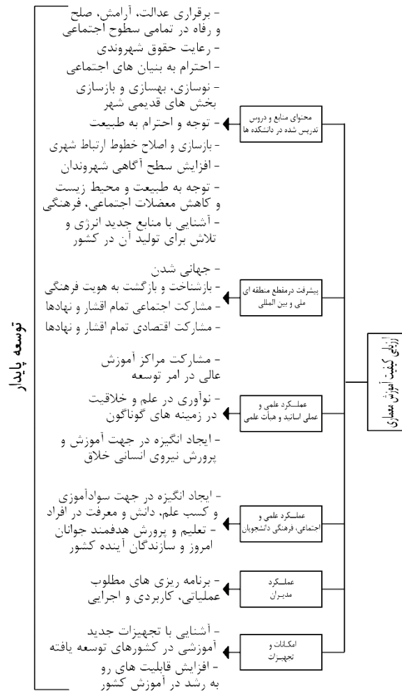
شکل ۴- الگوی ارزیابی آموزش معماری در چارچوب توسعه پایدار