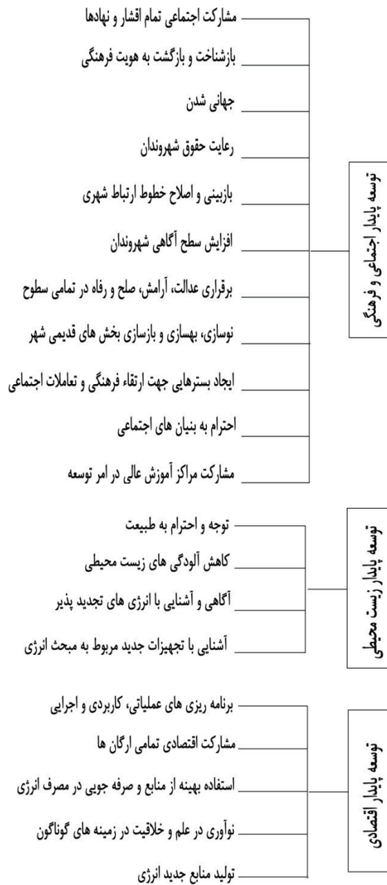
شکل ۱- فعالیت های لازم در مسیر توسعه پایدار